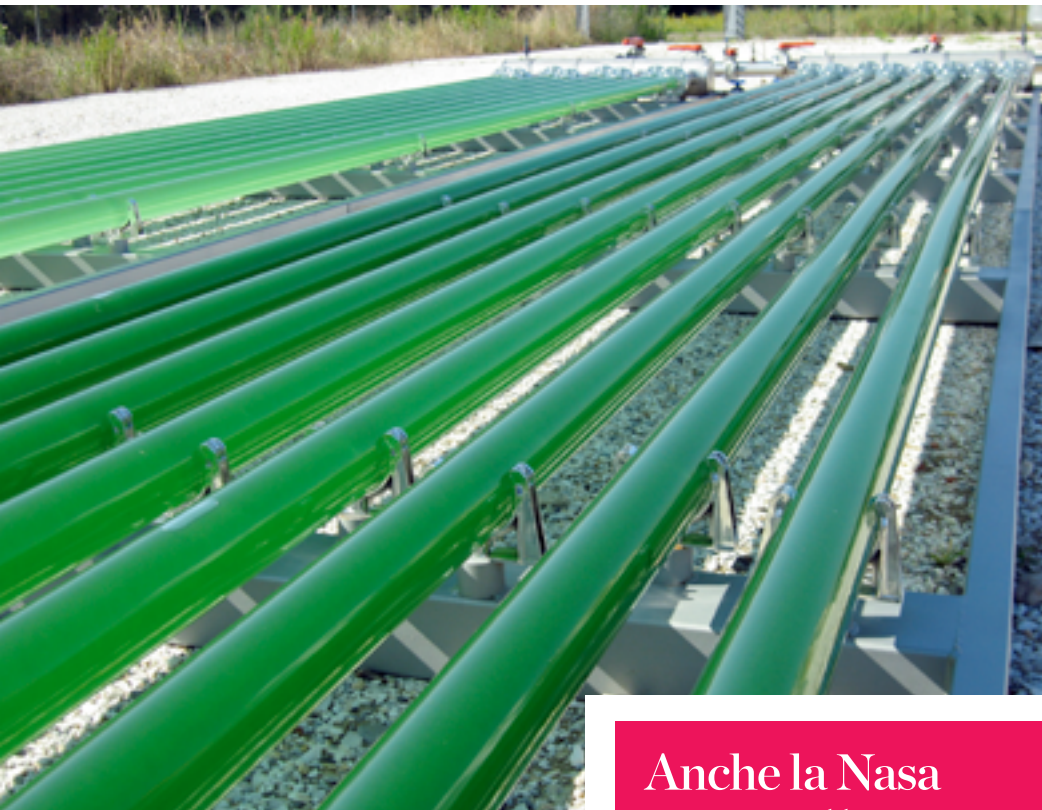
TUBI TRASPARENTI. Colture d'alghe in reattori tubolari alla F&M di Sesto Fiorentino: sono trasparenti per permettere la fotosintesi.