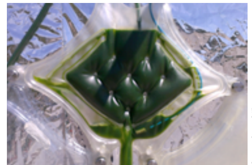
COLTIVAZIONI. Reattore per la coltura d'alghe ( Chlorella ) su pareti verticali: sarà usato all'Expo di Milano.

La fucoxantina, un carotenoide presente nelle alghe marroni e nelle diatomee, ha promettenti effetti antiobesità: nei topi brucia gli acidi grassi, trasformandoli in calore. La sostanza ha anche proprietà antiossidanti (per prevenire aterosclerosi, Parkinson, Alzheimer), attività anticancro e limita il fotoinvecchiamento cutaneo, proteggendo dai raggi UV.