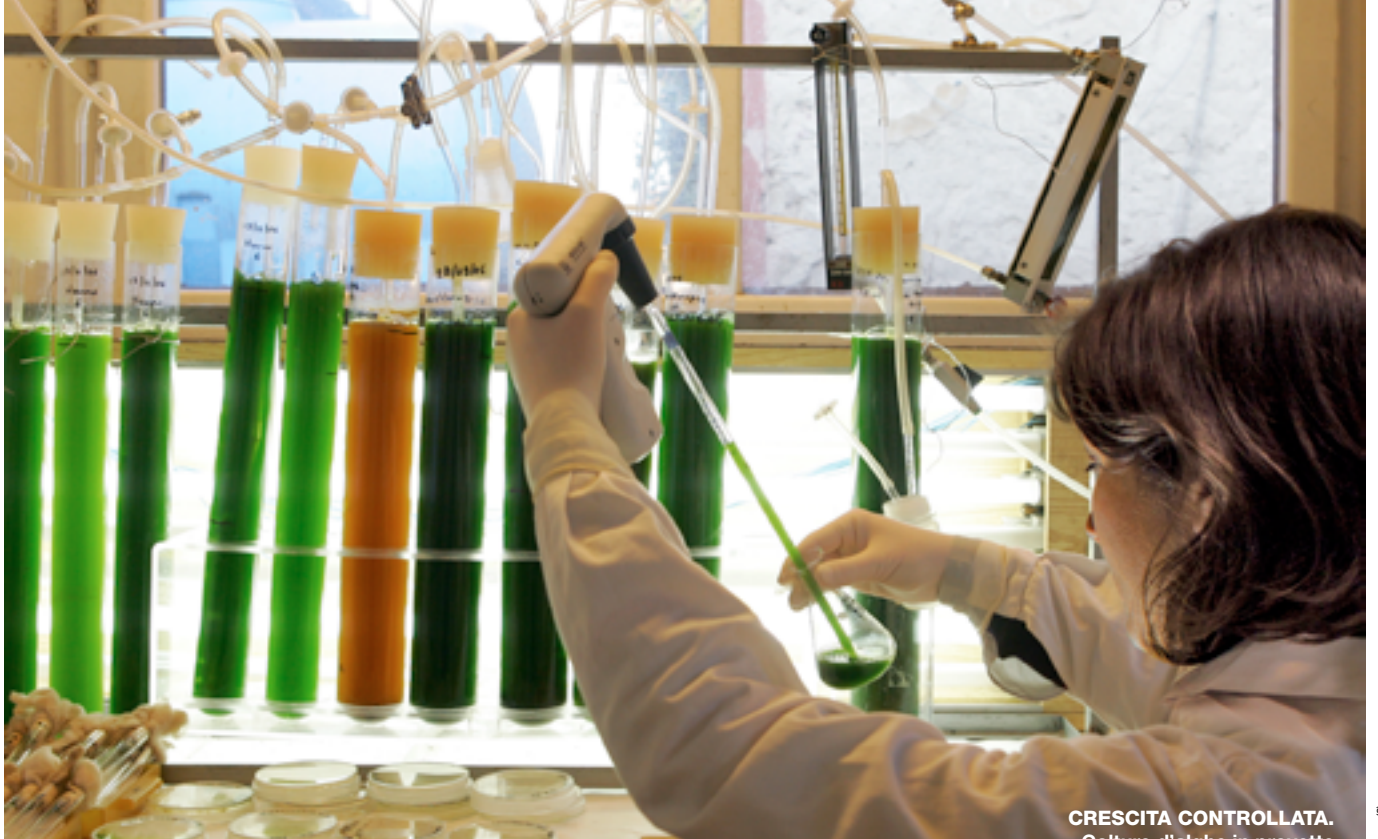
CRESCITA CONTROLLATA. Colture d'alghie in provette insufflate con aria arricchita di CO 2 all'Università di Firenze.