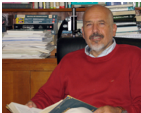
Università di Firenze

ORTI VERTICALI. Una serra di 1.000 m 2 con filari di fotobioreattori per coltivare l'alga Nannochloropsis : è la società Mac di Camporosso (Imperia).